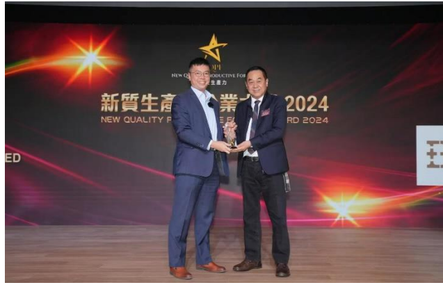
圖：亨利加集團榮獲「大灣區新質生產力企業大獎—金融服務業（家族辦公室組別）」